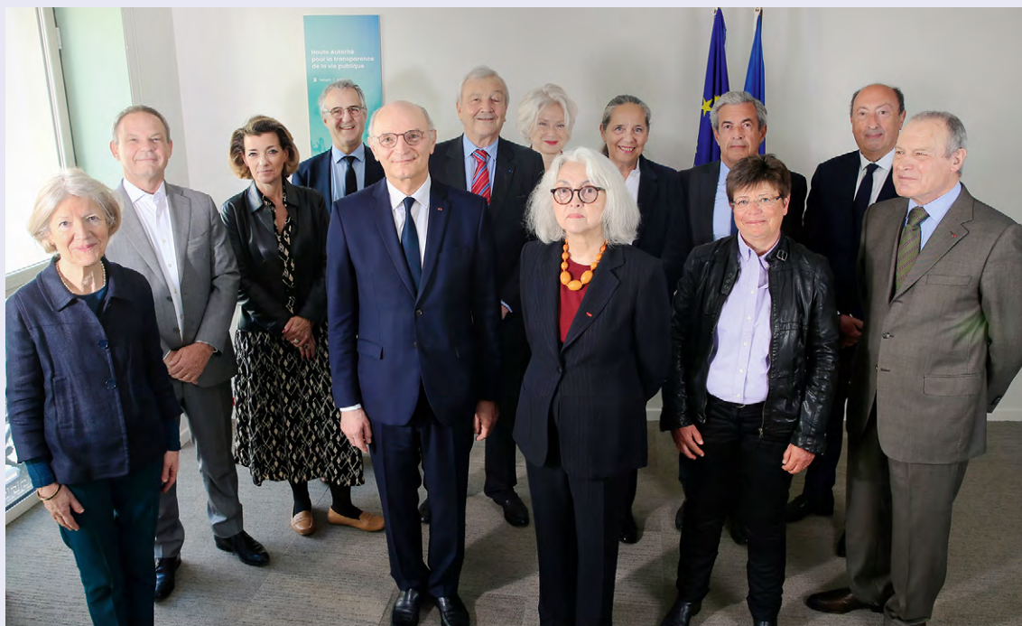
Le président et les membres du collège en 2022